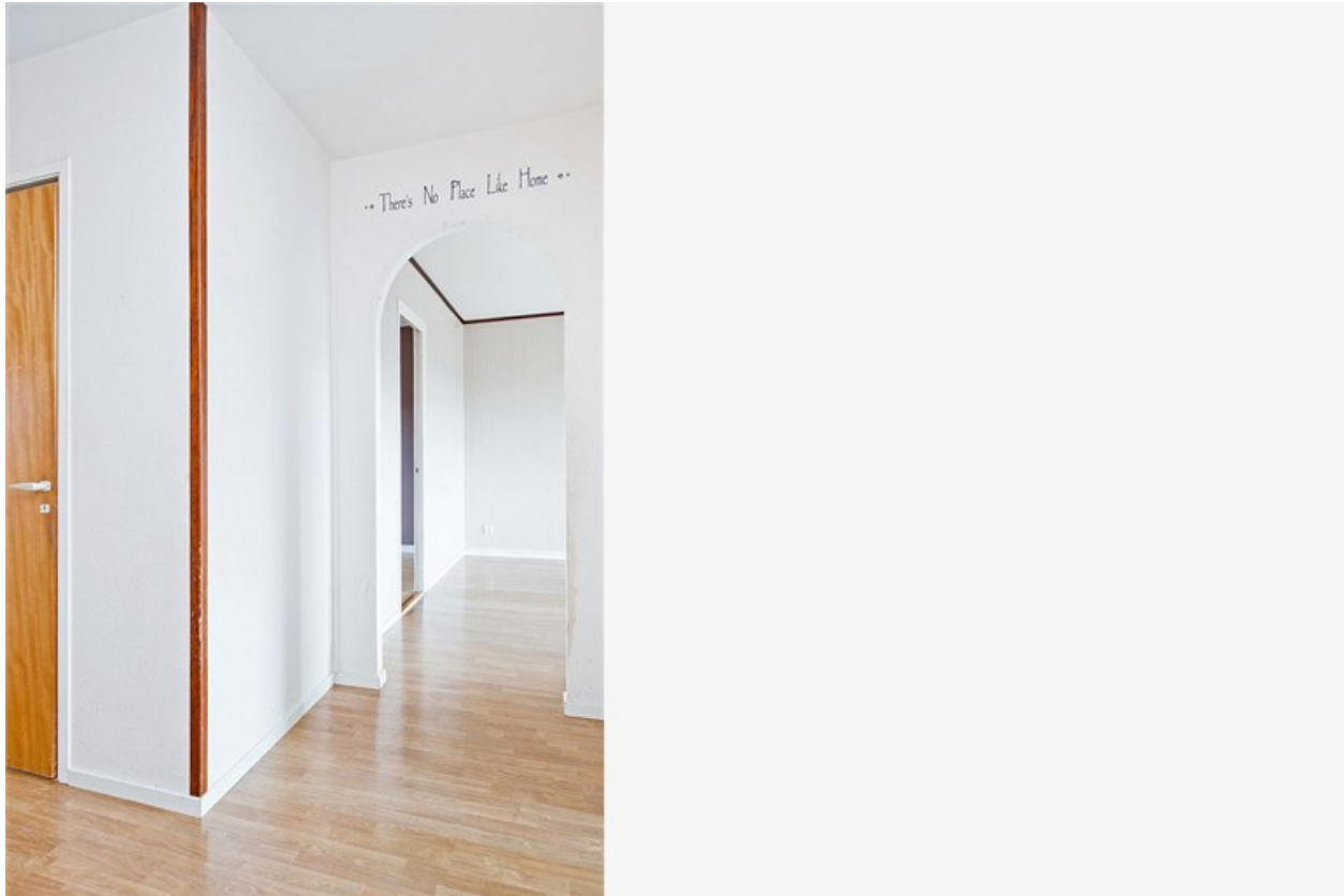
Förvaring i praktiskt klädkammare