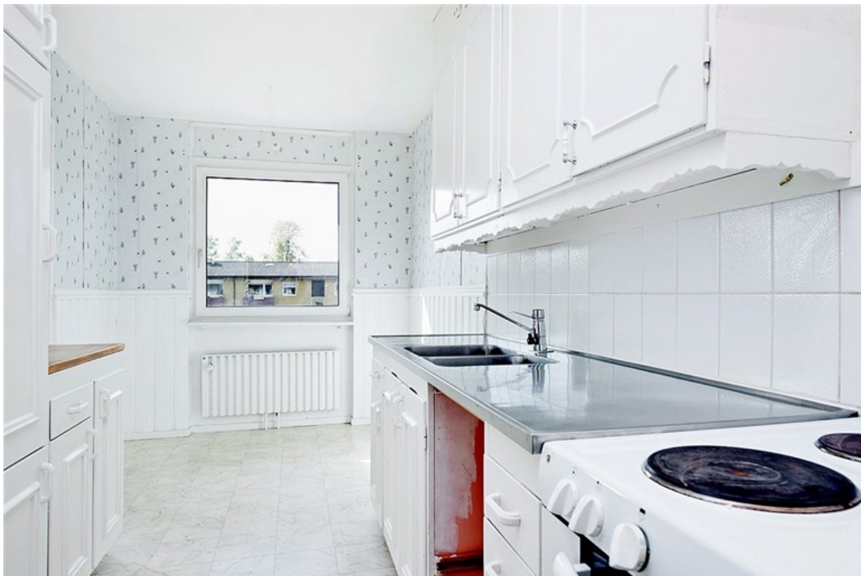
Matplatsen invid fönstret är given