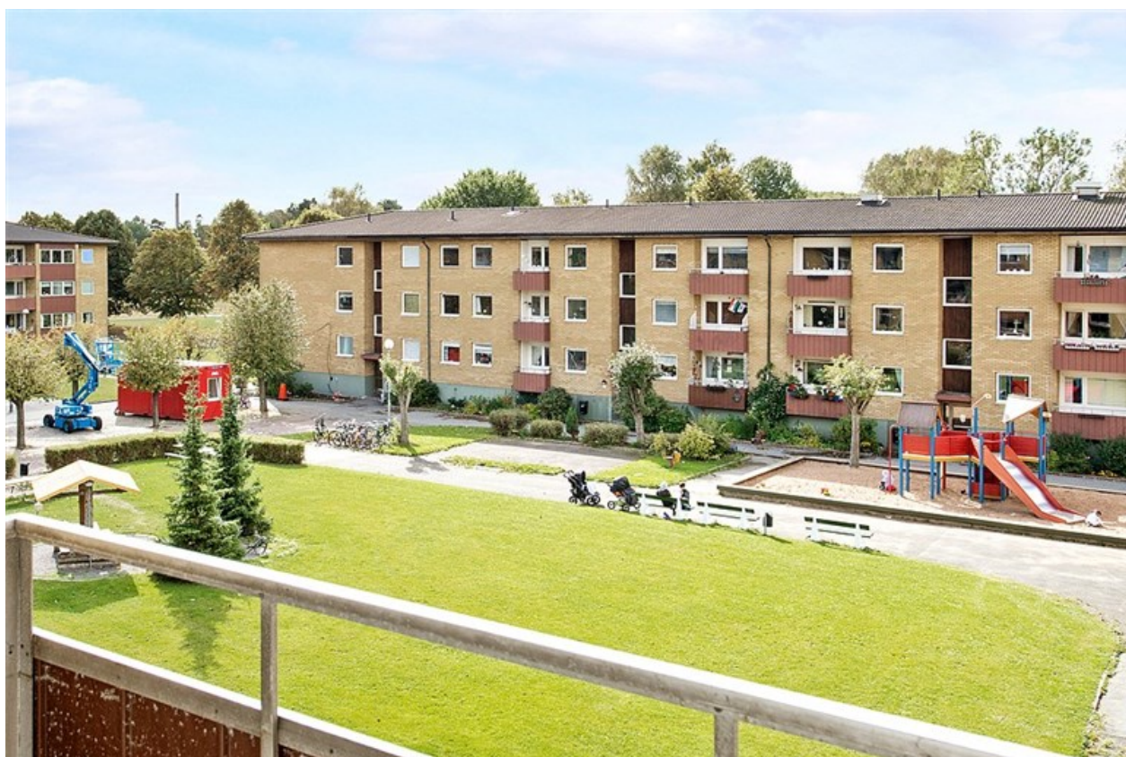
Välkomna till Bergkristallsgatan 28