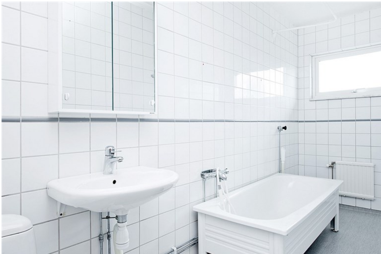
Helkaklat badrum med vädringsfönster