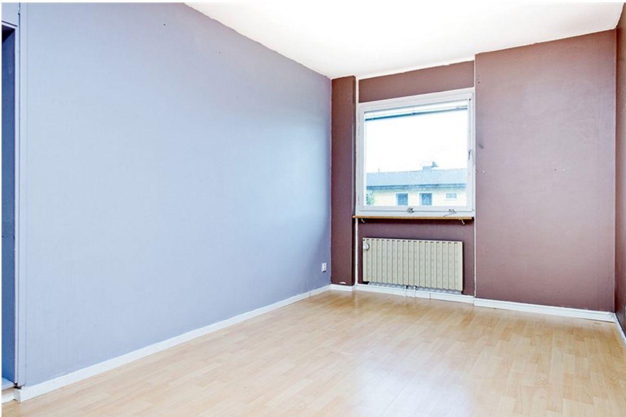
Plats för dubbelsäng med tillhörande möblemang